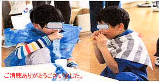
ご清聴ありがとうございました。